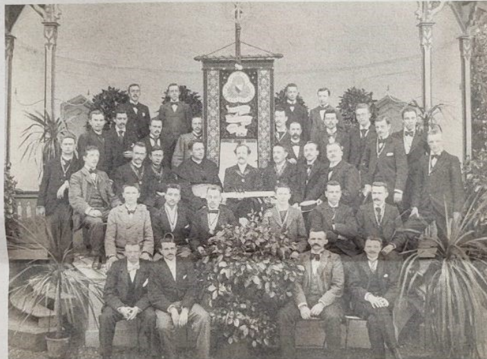
Het mogelijk oudste groepsportret van Veritas, uit 1897, toont zojuist geïnstalleerde nieuwe leden met het bestuur.

Begin twintigste eeuw ontstonden er echter steeds meer katholieke kostscholen. Die leverden beginnende studenten af die gewend waren aan toneel, sport en muziek, en die deze cultuur meenamen naar Veritas. In 1931 richtte Veritas een eigen tijdschrift op,